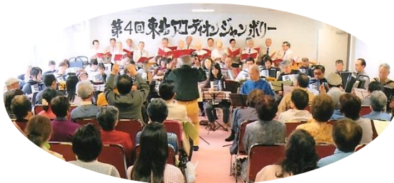
第4回東北アコジャンで東北との合同大合奏の様子