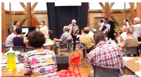
夕食後の交流会の様子