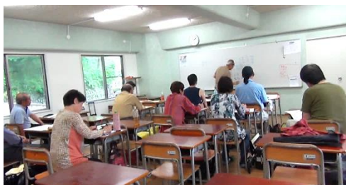
昨年の講義の様子(池田教室)