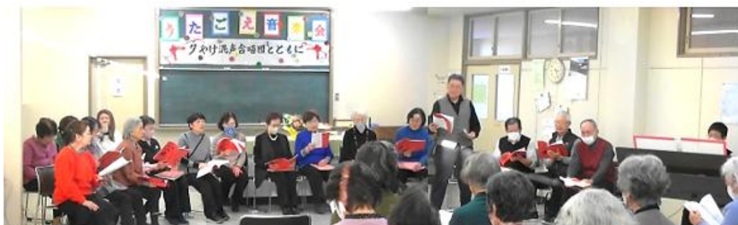
～みなさんとともに～リクエストコーナーの様子

再び合唱を楽しみます。後半最初の曲は「ダンカングレイ」(スコットランド民謡)♪ダンカングレイが お嫁を ハイ ハイディ フライ エ ライ・・・と歌います。歌詞を調べると、タンカングレイが求婚したとき、彼女にそっぽを向かれ悲しくなった。そんな言葉がくり返されます。言葉の後に歌われる“ハイ ハイディ フライ エ ライ”は、はやし言葉でしょうか、どこか陽気な感じのする歌でした。原詞の訳を