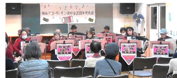
アンコール「踊り明かそう」演奏の様子